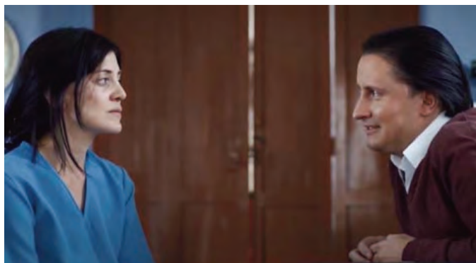
Imagen 5. Azules turquesas (2019). Directora: Mónica Mancero

Es un conocimiento disciplinario basado en el abuso, la represión, la violación y la tortura; es el que practica Camil con un doble discurso que oculta a la familia de los pacientes estas prácticas represivas bajo el disfraz de un conocimiento técnico de la rehabilitación de los adictos. Camil se inserta en la concepción nueva de Foucault de la “microfísica del poder” ya expuesta, con su respectivo régimen de “verdad” y poder sobre los cuerpos de los pacientes para castigarlos y abusarlos cruelmente.