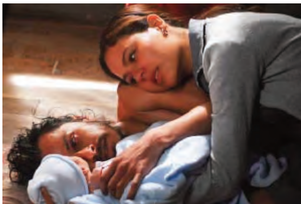
Imagen 2. Rabia (2009). Director: Sebastián Cordero

Rosa termina fortalecida como personaje muy dignamente; logra sobrevivir con mucha fuerza en una sociedad machista que maltrata a la gente más débil. Aunque no tenga suficiente libertad para convertirse en sujeto político, logra sobrevivir con una digna subalternidad.