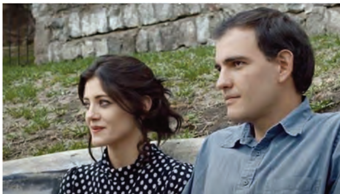
Imagen 6. Azules turquesas (2019). Directora: Mónica Mancero

bela, después de desintoxicarse, se encuentra románticamente con Matrio, su antiguo compañero y enamorado escondido en el centro que dirigió Camil (ver Imagen 6).