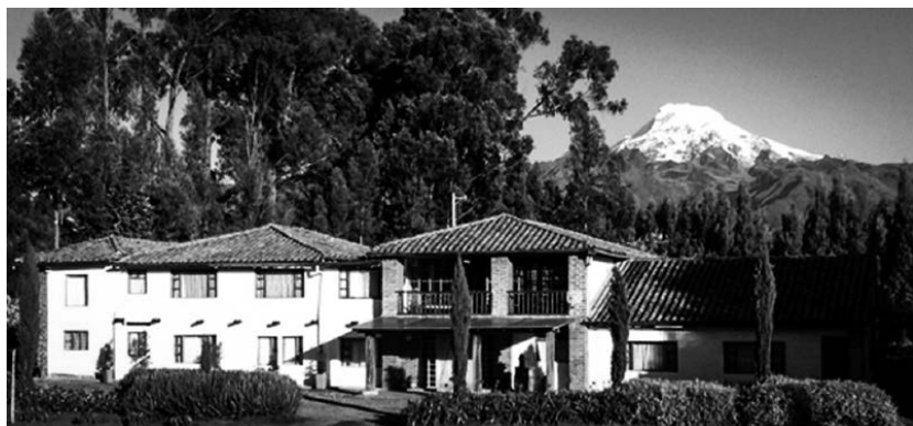
Figura 3. Armonía del paisaje del Nevado Cayambe y el hotel patrimonial Molino San Juan

tección de las tradiciones, costumbres y modos de vida locales revitalizando la identidad y la cultura del pueblo Kayambi.