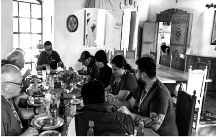
Figura 10. Vista de restaurante de Molino San Juan, y su atención personalizada a turistas extranjeros