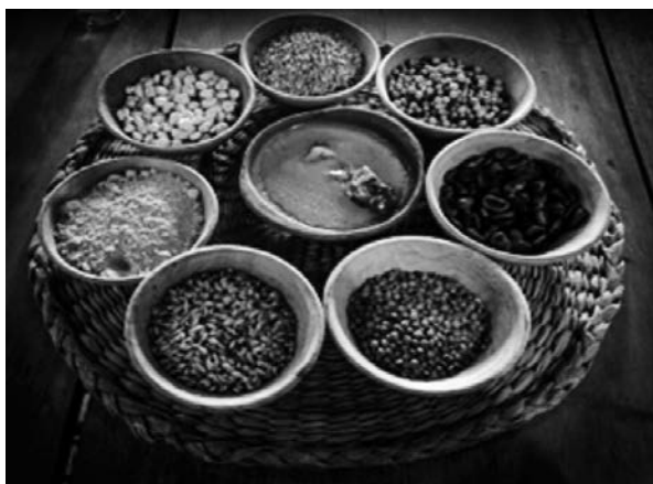
Figura 12. Ingredientes de emblemático "Achu Jacu" Patrimonio inmaterial de la memoria colectiva del Pueblo Kayambi

La Hacienda Molino San Juan, es un espacio donde la historia y la arquitectura colonial se unen; también es un bastión de la gastronomía tradicional ecuatoriana, especialmente de la región andina. Este rincón culinario honra las recetas ancestrales y los ingredientes locales que han sido el alma de los Andes durante generaciones.