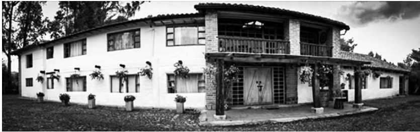
Figura 1. Hotel Patrimonial Molino San Juan