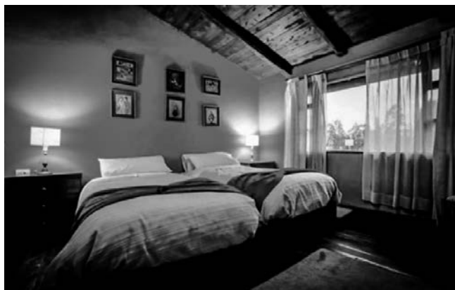
Figura 7. El placer del descanso en una habitación de Molino San Juan