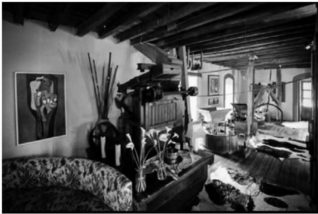
Figura 6. Sala museo "elementos del icono Molino San Juan"

En el cantón Cayambe ubicado a una altitud de 2 790 m.s.n.m. situado al norte de la provincia de Pichincha en Ecuador, interconectado por la Panamericana Norte con las ciudades de Quito al sur, al norte con las ciudades de Otavalo, Atuntaqui e Ibarra. El Molino San Juan Hacienda se ubica diagonal al pueblo de Santa Clara a seis kilómetros al norte de la ciudad de Cayambe.