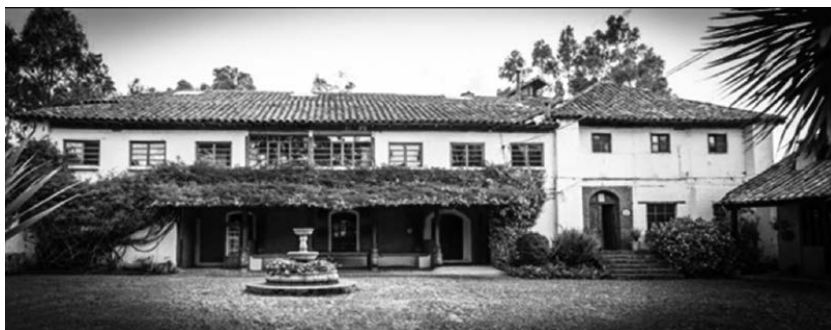
Figura 4. Infraestructura patrimonial El Molino San Juan, hoy un acogedor espacio de conocimiento Sala Museo, Cocina y Restaurante