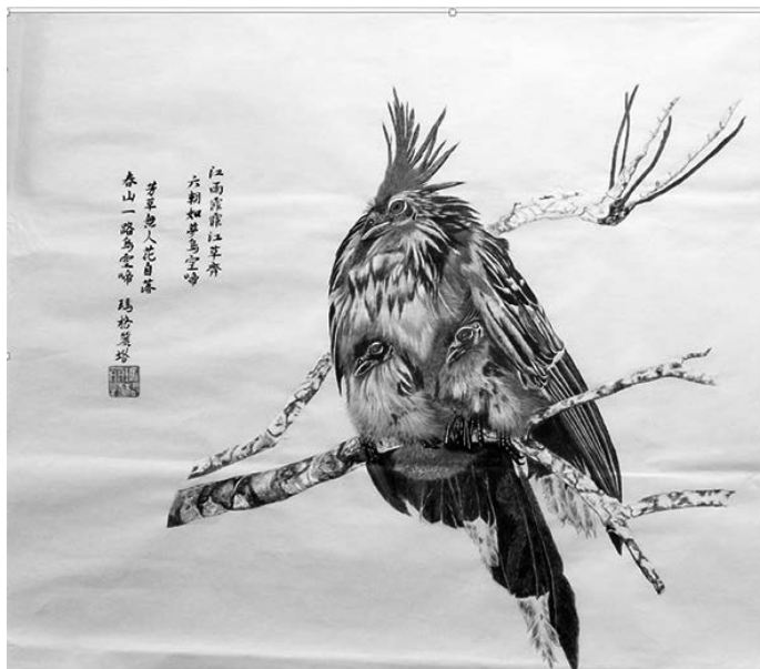
Figura 2. Pintura 1 Hoazin Téc. Dim. Tintas/gongbi hua, papel arroz, 50x66 cm. Autora: Margarita Guevara Cueva Fotografía de Gilberto Rodríguez, año 2025