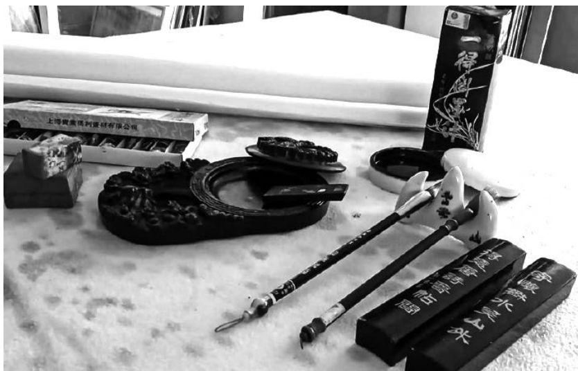
Figura 4. Los cuatro tesoros del escritorio chino

La piedra de entintar ( yàn ) es el instrumento sobre el cual se muele la tinta en barra con unas gotas de agua. Estas piedras, elaboradas tradicionalmente en cerámica o roca tallada, tienen diseños refinados que las convierten en auténticas piezas de arte. A través del movimiento circular del pincel sobre la piedra, se inicia el acto caligráfico como un rito de concentración, en el que el artista prepara la sustancia con la que dotará de forma a sus ideas.