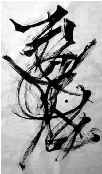
Figura 1. Caligrafía 1. Fragmento Anónimo I Téc. Dim. Tinta china 52x38 cm. Papel amate. Autora: Margarita Guevara

Finalmente, es importante destacar que, a diferencia de otros sistemas de escritura antiguos, como los jeroglíficos egipcios, la escritura maya o la cuneiforme sumeria –todos los cuales dejaron de usarse en sus contextos originales, el sistema gráfico desarrollado a partir del Jiǎgǔwén ha permanecido en uso ininterrumpido, siendo el único sistema ideográfico ancestral que ha evolucionado hasta formar parte integral de una lengua moderna viva.