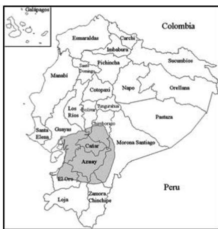
Figura 2. Mapa que muestra los parámetros generales del territorio cañari en la época precolombina

interesante notar que algunos de los primeros registros documentales también sugieren que las comunidades cañaris mantenían tierras propias en los valles cálidos de menor altitud para asegurar un suministro constante de algodón y coca. 5 Este tipo de organización remite a la idea de microverticalidad propuesta originalmente por Udo Oberem, que describe una forma particular de acceso y orientación hacia distintas zonas de recursos en proximidad relativa como las que se encuentran en los Andes septentrionales. 6