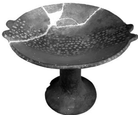
Figura 8. Compotera cañari con influencia inkaica en el Museo de Culturas Aborígenes, Cuenca, Ecuador (c. 16 cm de altura, 28 cm de diámetro de la placa)