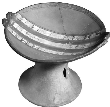
Figura 1. Vasija híbrida de estilo inka-cañari con base alta en pedestal, conocida como compotera, perteneciente a las colecciones del Museo Americano de Historia Natural (14 cm de altura, 20 cm de diámetro del cuenco; núm. cat. B/8268).