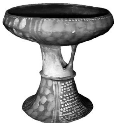
Figura 6. Compotera estilo Cashaloma con decoración tanto positiva en pintura blanca como negativa, y base en pedestal con la característica abertura típica. (c. 22 cm de altura).

Colección privada, provincia de Cañar, Ecuador.