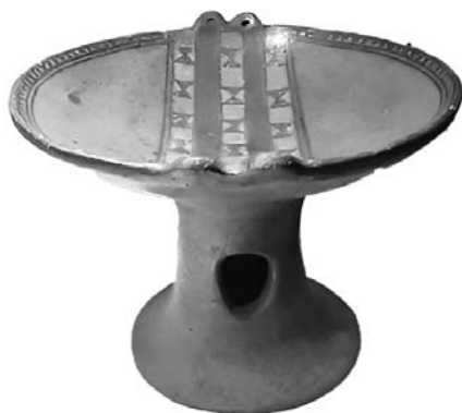
Figura 5. Vasija híbrida de estilo inca-cañari en el Museo Nacional de Arqueología, Antropología e Historia en Lima, casi idéntica a la compotera del Museo Americano de Historia Natural mostrada en la Figura 1 (c. 15 cm de altura)

kaico, o puku , se une a la base alta de pedestal de una compotera cañari. El plato inkaico sustituye a la parte superior típica de la forma cañari, que normalmente consistiría en un cuenco poco profundo hecho (desde luego) en el estilo local. Un ejemplo de la forma cañari ecuatoriana se muestra en la Figura 6.