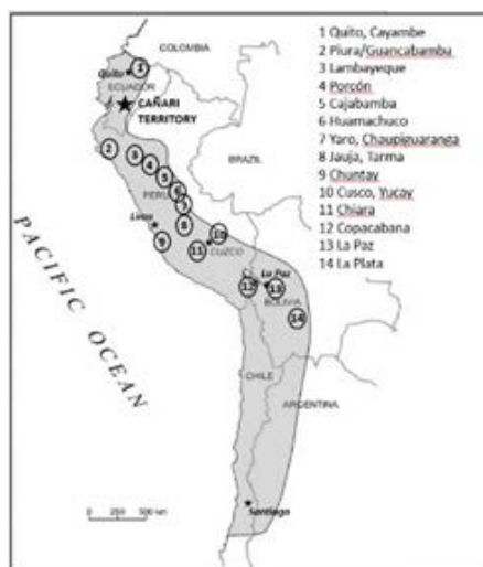
Figura 3. Mapa que indica la dispersión general y las localizaciones de las colonias reubicadas de mitmaqkuna cañaris en el siglo XVI Adaptado de Solari 2015

y Lambayeque, así como en Lima; y en la sierra, documentos etnohistóricos indican su presencia en Cajamarca, Huánuco, Pasco, Huamachuco, Jauja, Junín, Ayacucho y Cusco. En Bolivia, se registraron comunidades cañaris en Copacabana, La Paz y Sucre. 20 Así, podemos ver que, mediante su política de deporta-