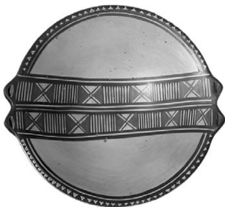
Figura 7. Puku inkaico con dos pares de nódulos dobles en el borde opuestos entre sí y un panel central con una doble fila de motivos en forma de X y barras del sitio de Pachacamac, Perú (17,3 cm de diámetro) Museo de Arqueología y Antropología de la Universidad de Pennsylvania, núm. cat. 31085; fotografía de la autora

apéndices a manera de asa y que, en su lugar, presentan dos pares de salientes dobles ubicados en lados opuestos del borde del plato (Figura 7). Dentro del conjunto cerámico estatal inkaico, el puku es la forma que muestra mayor libertad de expresión artística, exhibiendo una amplia gama de motivos policromos pintados y formatos de diseño.